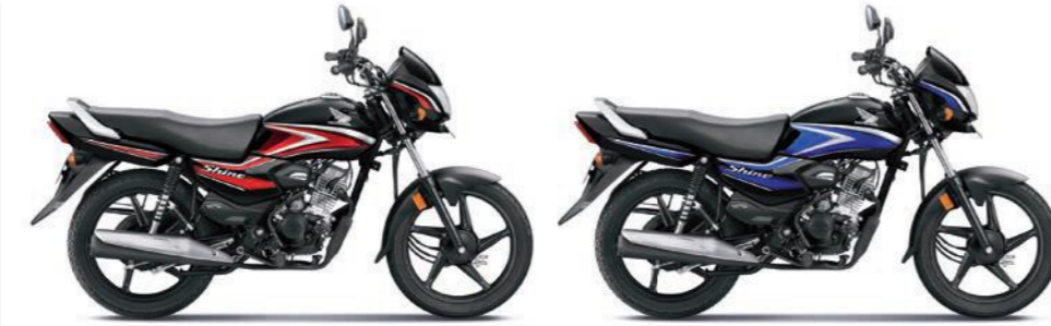
रेड के साथ ब्लैक ब्लू के साथ ब्लैक