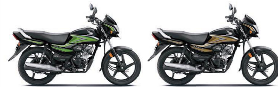
ग्रीन के साथ ब्लैक गोल्ड के साथ ब्लैक